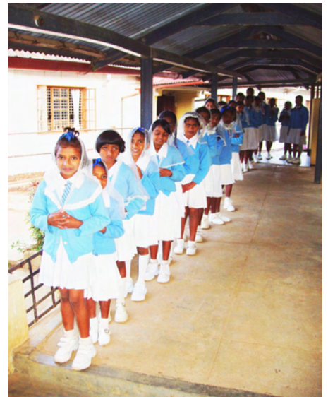
Waisenkinder aus St. Theresa tragen ihre Schulkleidung

Das Ergebnis unserer diesjährigen Benefizaktion kann sich sehen lassen. Insgesamt sind durch den Weihnachtsbasar 8484.- € erwirtschaftet worden. Hinzu kommen Spenden der Eltern und des Zweckverbandes Ostholstein, die es ermöglichten, für das Waisenhaus in Sri Lanka einen Betrag von 10913.- € in diesem Schuljahr bereit zu stellen. Durch unsere Hilfe ist es einmal mehr gelungen, Kindern die Chance zu geben, aus ihrem Leben etwas zu machen.