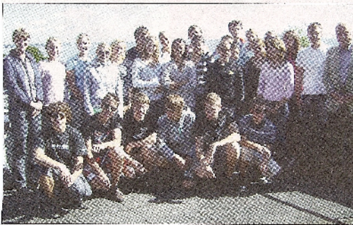
Auf dem Dach des OGT: die Gäste aus Davos mit ihren Gastgebern.

Tdf. Strand. Die Gastfreundschaft des Ostsee-Gymnasiums kennt keine Grenzen: Nachdem das OGT in diesem Jahr bereits Schüler und Schülerinnen aus Schweden und Italien empfangen konnte, gesellten sich nun weitere 14 Gäste aus dem schweizerischen Davos dazu.